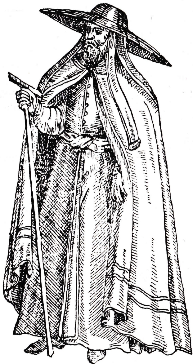
ΙΕΡΕΜΙΑΣ ὁ Β', φέρων σκιάδιον βυζαντινὸν καὶ ἐνδύματα τῆς ἐποχῆς του, κατὰ σχέδιον τῆς ἐποχῆς.